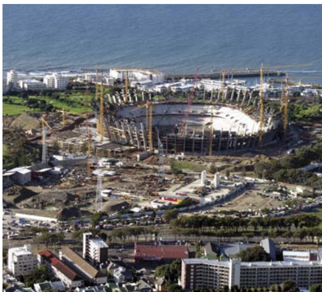
Green Point Stadium i Cape Town

Som sagt, snart är det kick off för en historisk nittonde VM-turnering. Redan nu kan man vara säker på att Afrika, dess folk samt kultur kommer att ge en mycket intressant prägel åt spelen.