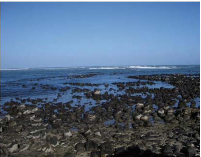
Afrikan läntisin piste: Le Point des Almadies

JV: Harkitsen kirjalle alaotsikkoa 'Rollaattorilla rannikolta rannikolle'.