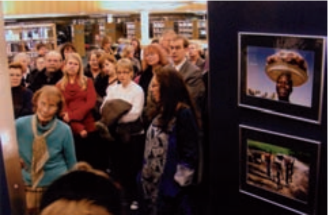
Kuva: Matti Kivekäs

TURUN UUESSA JA UPEASSA pääkirjastossa minulla oli tammikuun ajan näyttely, jonka kuvat olin pääosin kuvannut viime vuonna työskennellessäni Vuoden Taitelijana Villa Karossa. Näyttelyssä oli esillä myös Afrikka-aiheista kirjallisuutta sekä taide- ja rituaaliesineitä. Samaan aikaan siellä oli myös Kapua-ryhmän näyttely Keniasta. Ehdotin kirjastolle afrikkalaista iltaa näyttelyitten yhteyteen ja olen iloinen, että se onnistui yli kaikkien odotusten. Kirjastossa pidettiin monipuolinen ohjelmallinen Afrikka-ilta.